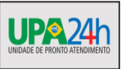
Passo a passo da UPA 24h