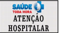
Passo a passo do CAH