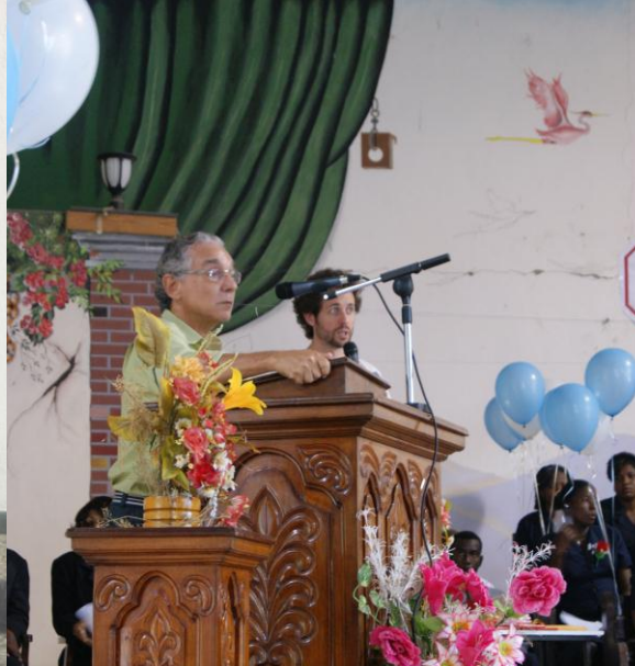
Formação da Primeira Turma de ACS – Haiti – 31.03.11