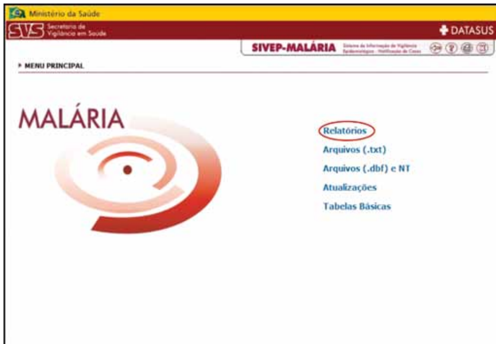
Figura 1. Sivep_malária