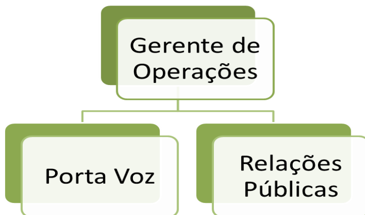
Figura 2. Staff de Comando em um Sistema de Comando de Operações

Para a operacionalização do COES em um SCO é necessário nomear um Gerente de Operações para cada evento e determinar as habilidades técnicas necessárias para a resposta ao evento. Esta nomeação será feita pelo Secretário de Vigilância em Saúde, no momento da ativação do COES (critérios no Anexo 3). À medida que o evento cresce, o Gerente de Operações pode delegar autoridade a outros, caso seja necessário, para o desempenho de determinadas atividades. Quando a expansão é necessária, o Gerente de Operações estabelecerá as posições do Staff de Comando (posições de apoio).