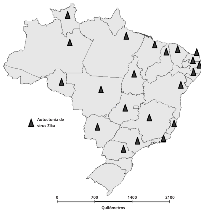
Figura 2 – Distribuição dos casos importados e dos casos autóctones de febre de chikungunya, por município e Unidade da Federação de residência, Brasil, 2014 a 2016