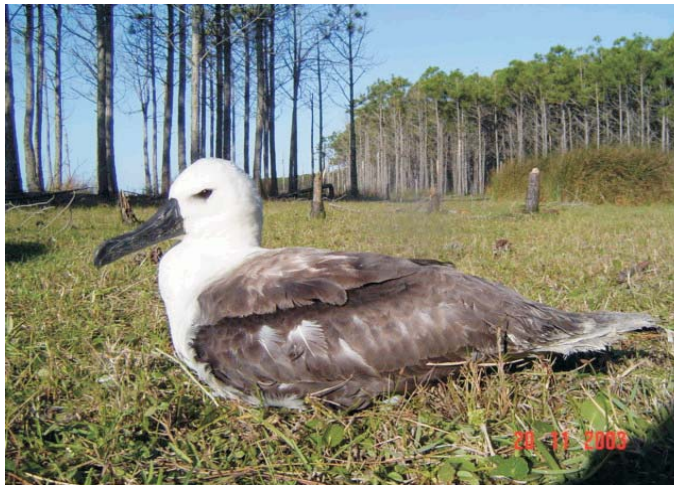
Foto 6 - THALASSARCHE CHLORORHYNCHOS